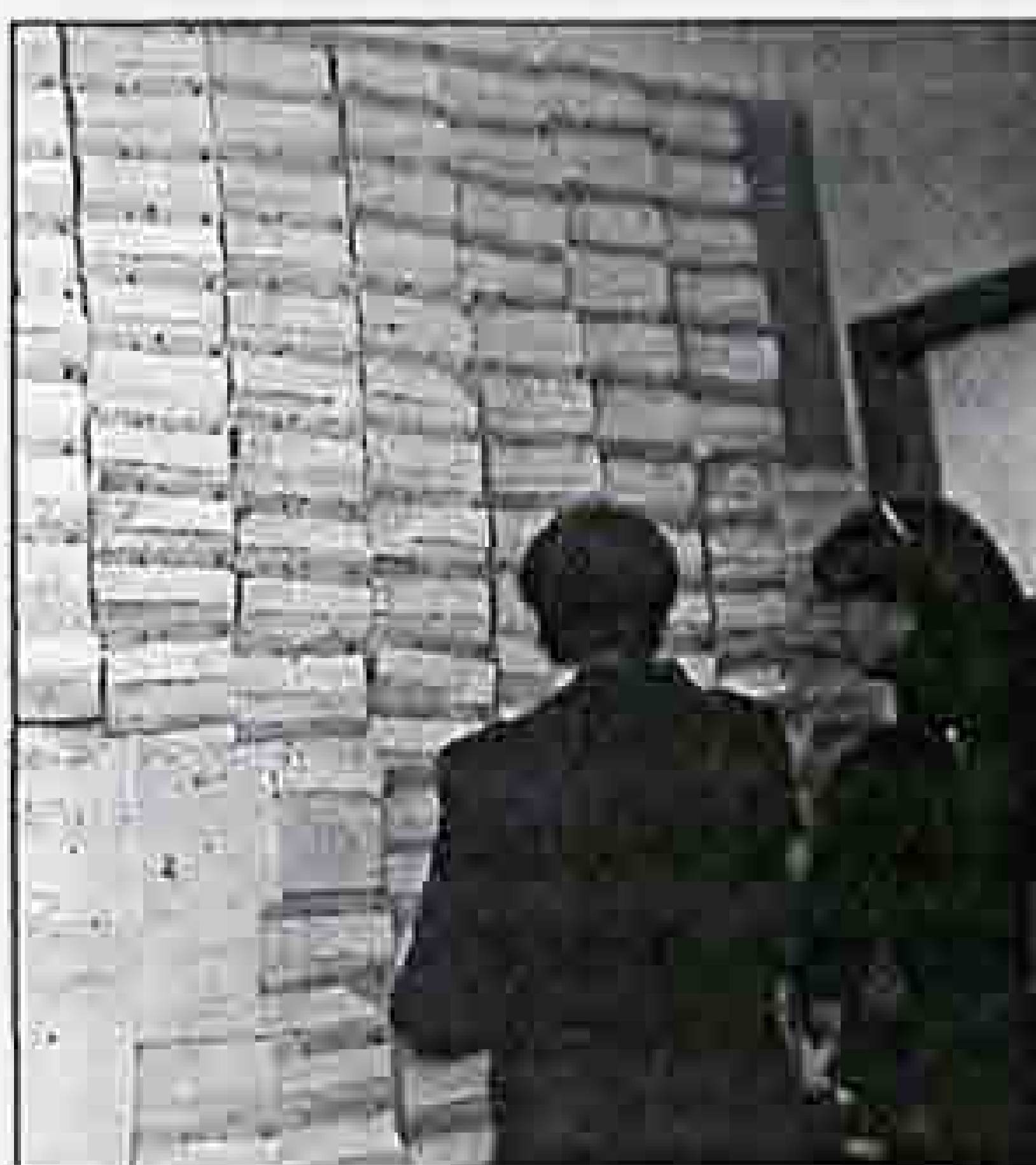
Telegramas de condolencia recibidos por el PSE. Una de las coronas enviadas a la sede.

Una vez más, la clase política y toda la sociedad volvió su mirada hacia el País Vasco para despedir a un dirigente histórico que se fue entre ovaciones y entre evocaciones a la paz y a la lucha.