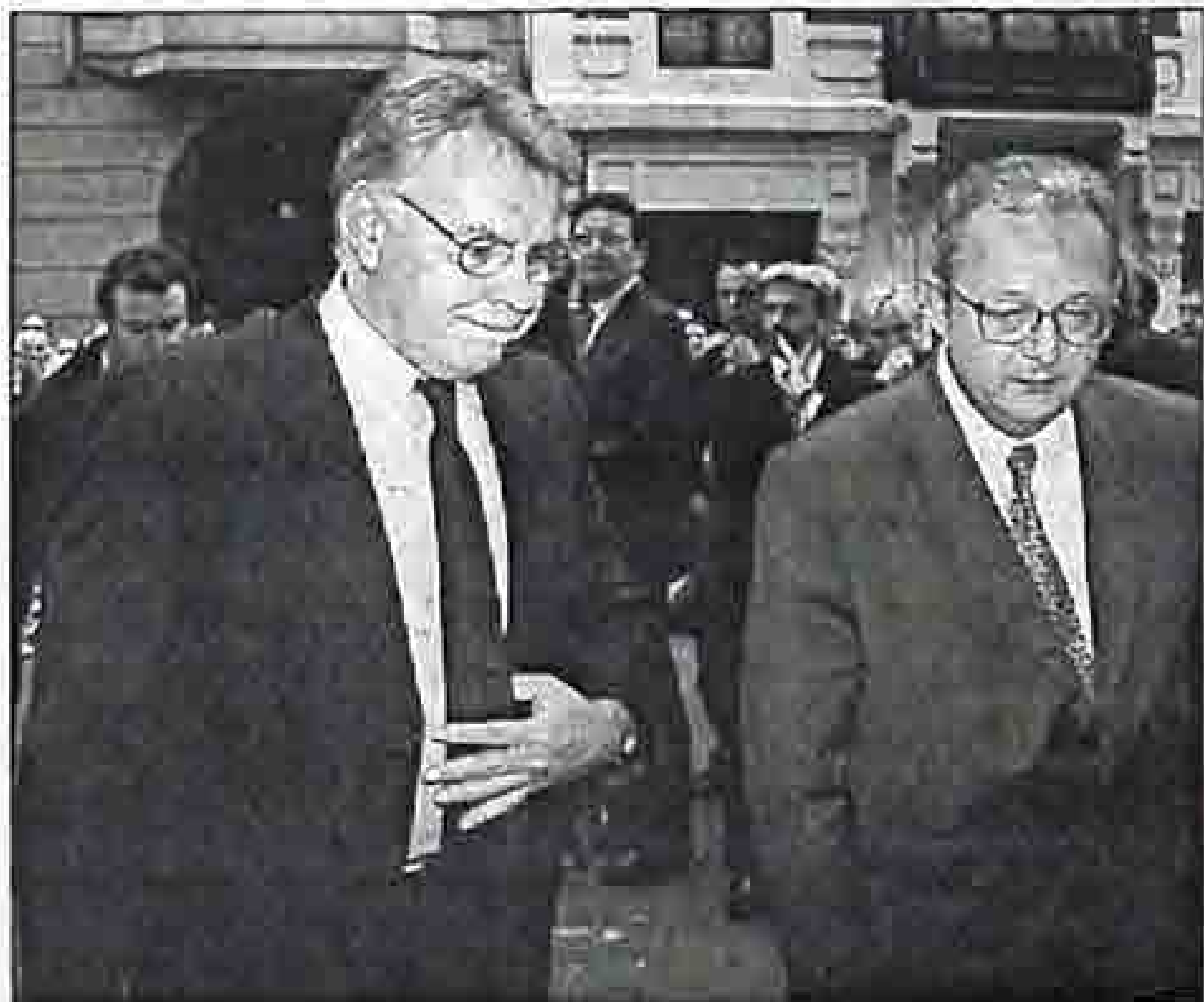
Felipe González, con José María Benegas, llega a la capilla ardiente.