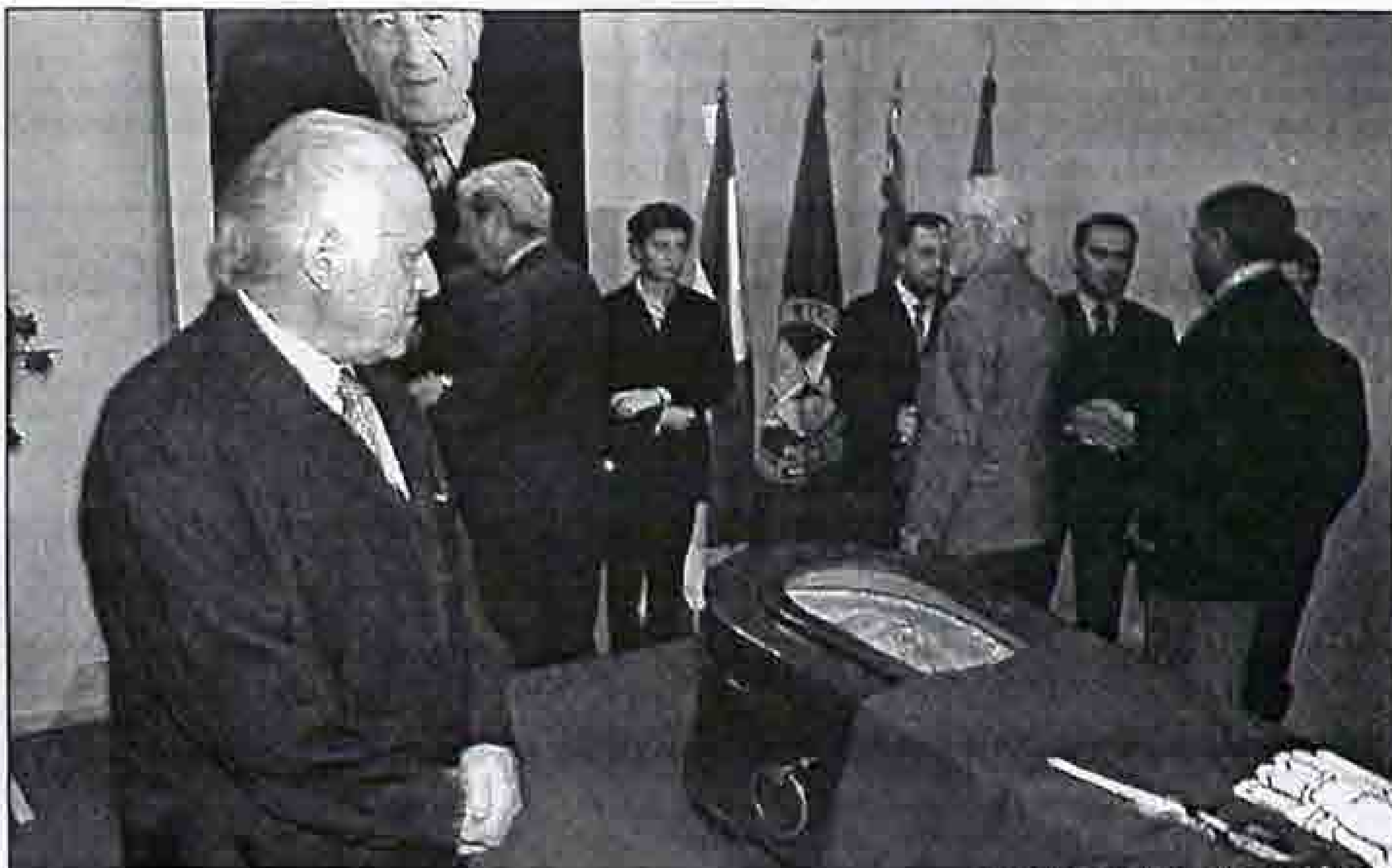
Arzalluz observa el féretro de Rubial, ayer en la capilla ardiente.

▶ Carlos Garaikoetxea. El sucesor de Rubial al frente del Gobierno vasco encuadró al fallecido en una