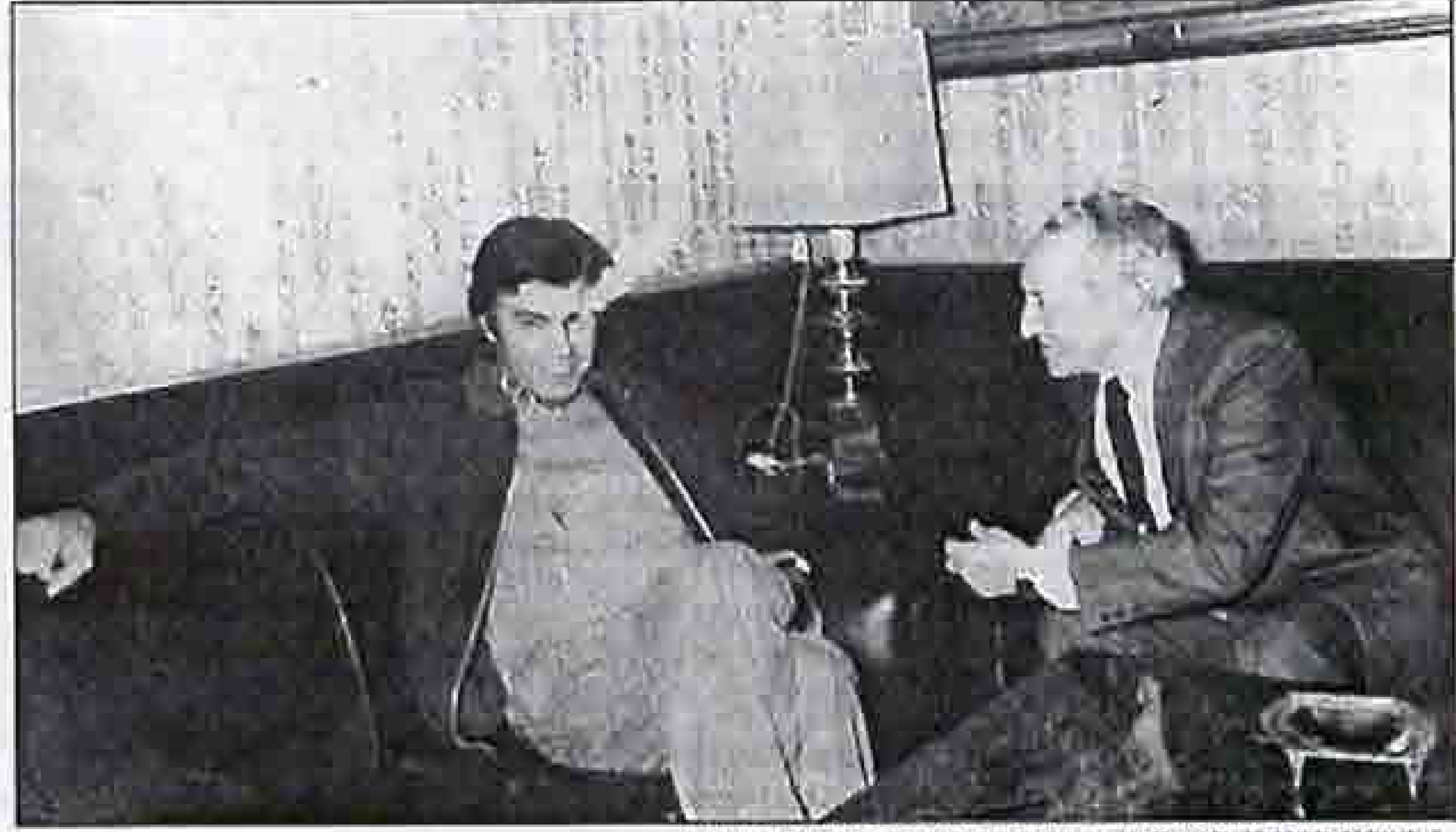
IMAGENES EXTRAIDAS DEL LIBRO «RAMÓN RUBIAL. UN COMPROMISO CON EL SOCIALISMO»

UNA INSTITUCION. Si Felipe González ha representado el socialismo moderno, Ramón Rubial ha representado la transición del socialismo histórico y su adecuación a la actual etapa. Rubial tuvo una destacada actuación en la preparación del Congreso del PSOE de Suresnes en 1974, donde los jóvenes liderados por González tomaron las riendas del partido. En la imagen, ambos en el despacho de Rubial cuando fue presidente del Consejo General Vasco.