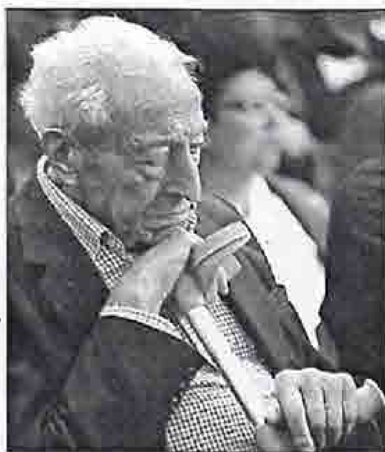
Al pie del cañón ➤ En un acto electoral en Barakaldo el pasado mes de octubre.