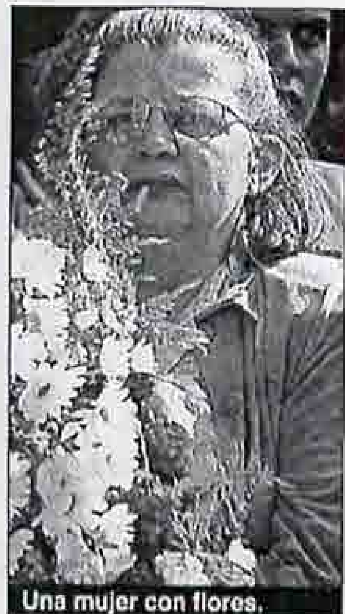
Una mujer con flores.