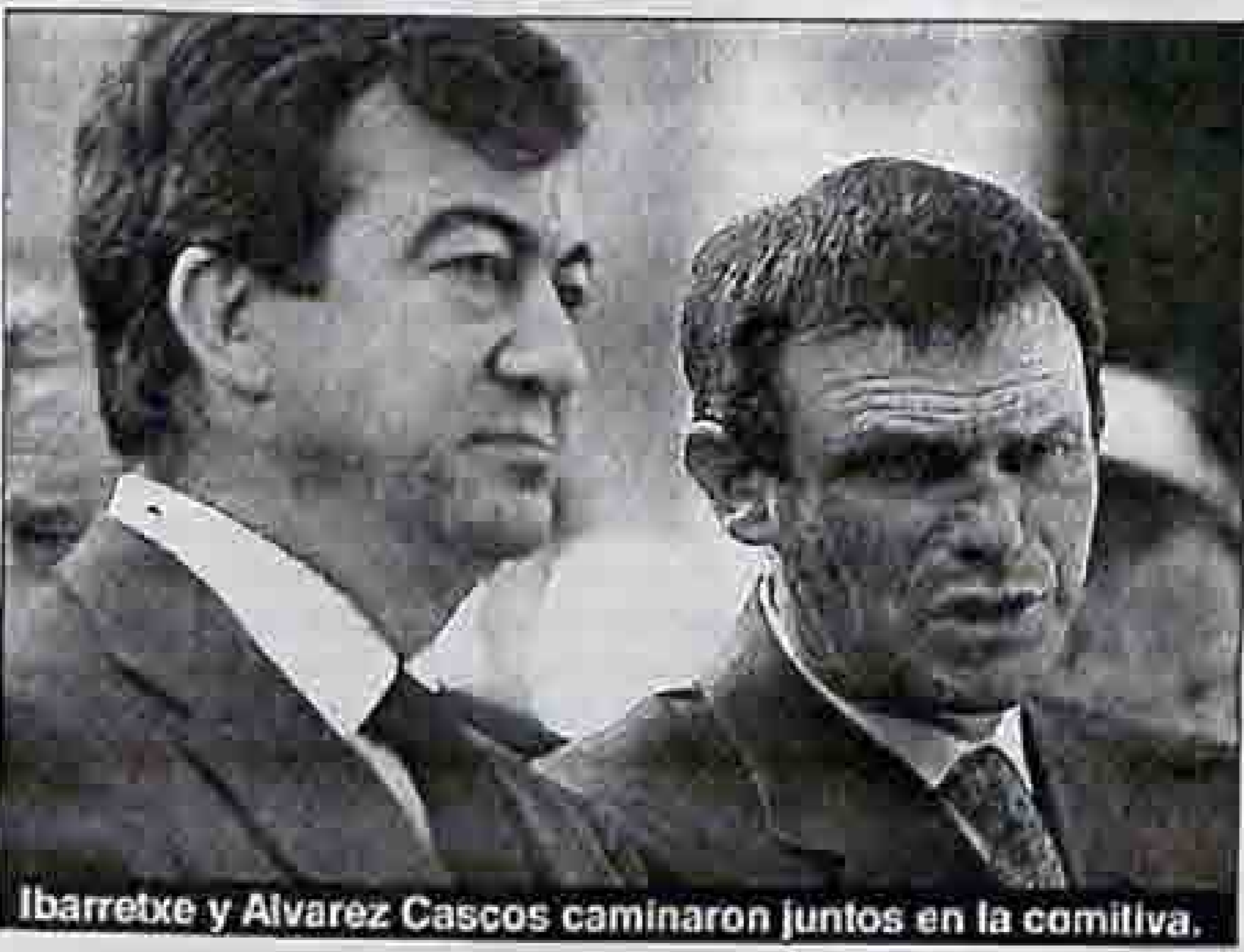
Ibarretxe y Alvarez Cascos caminaron juntos en la comitiva.