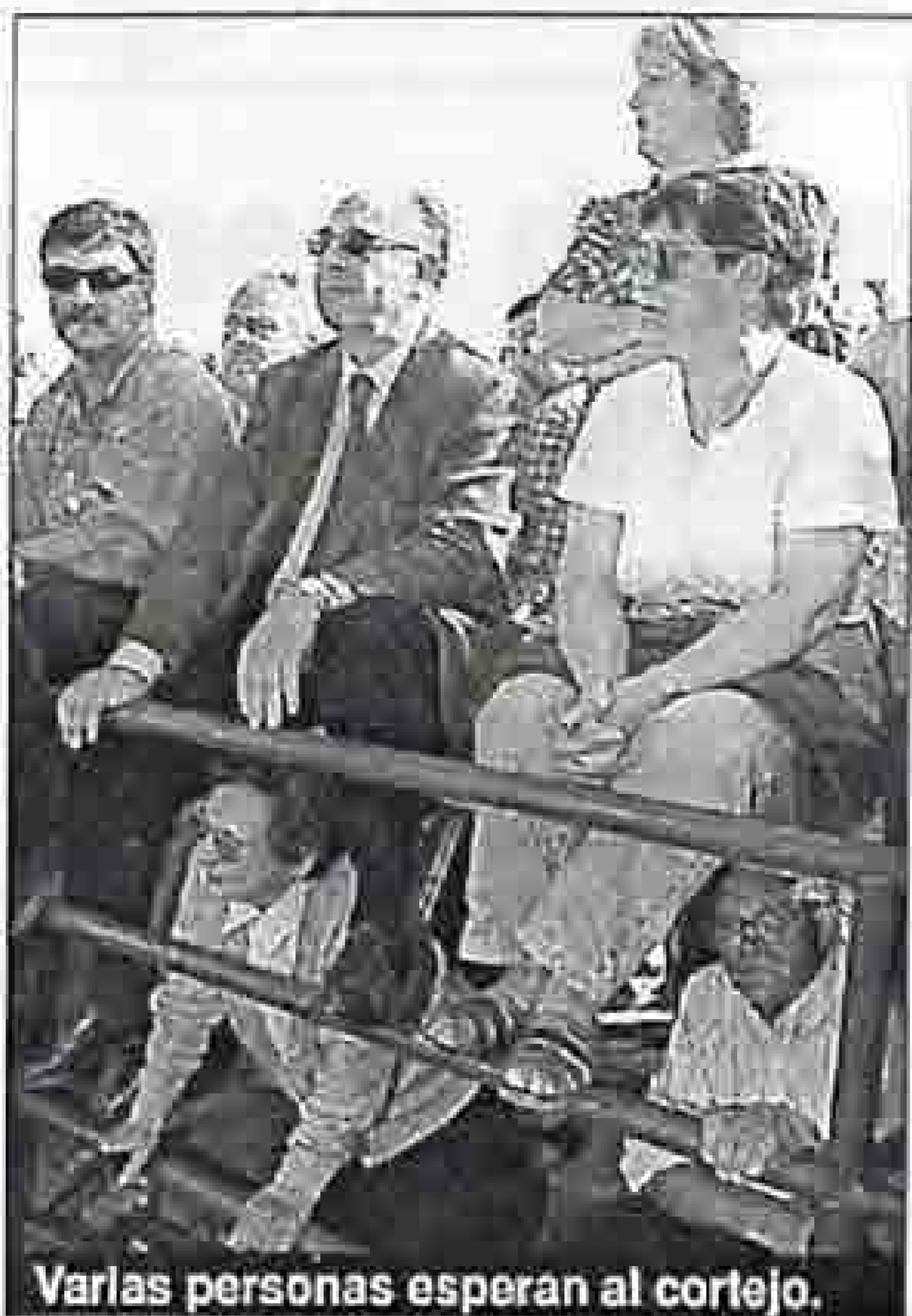
Varias personas esperan al cortejo.