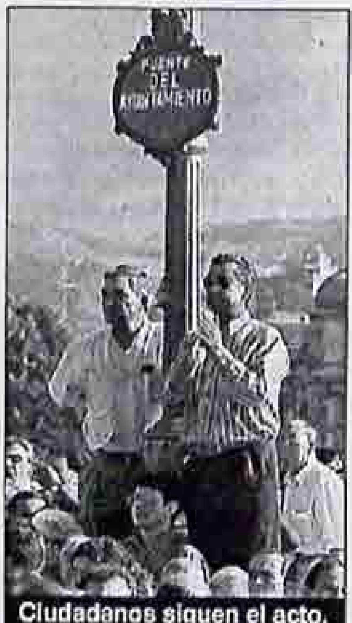
Ciudadanos siguen el acto.