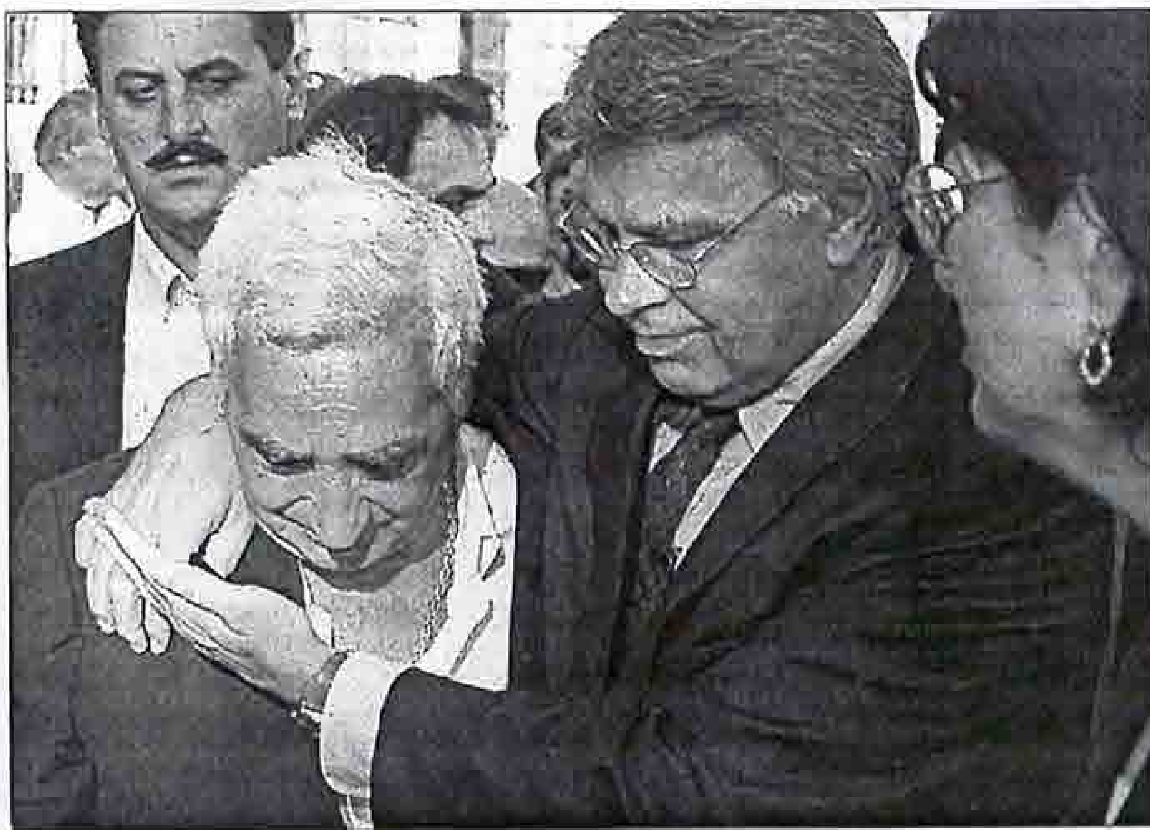
J. L. NOGITO

El ex-secretario general del PSOE destacó la «coherencia» de