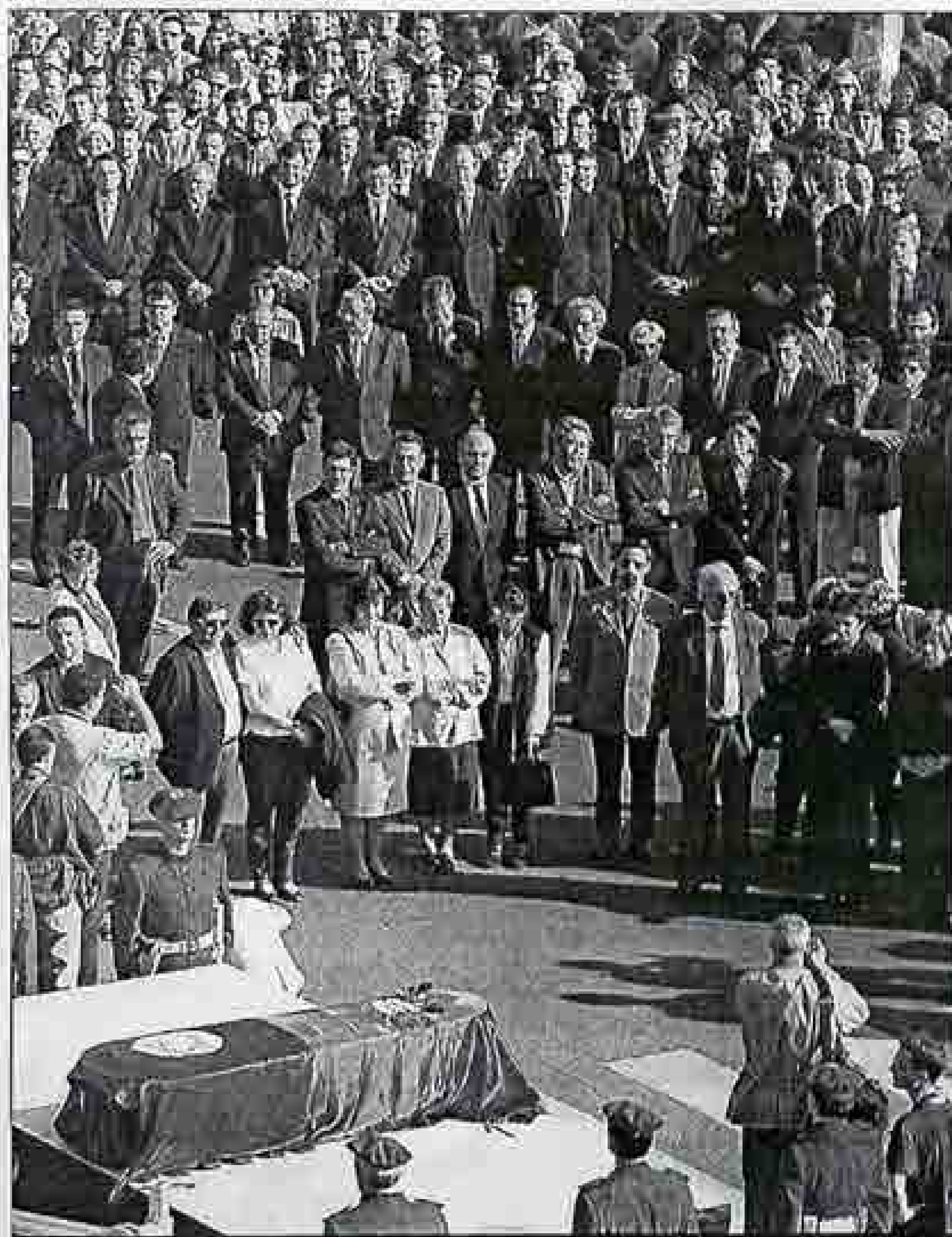
Familiares, líderes socialistas y representantes institucionales, ante el féretro, en el Ayuntamiento.