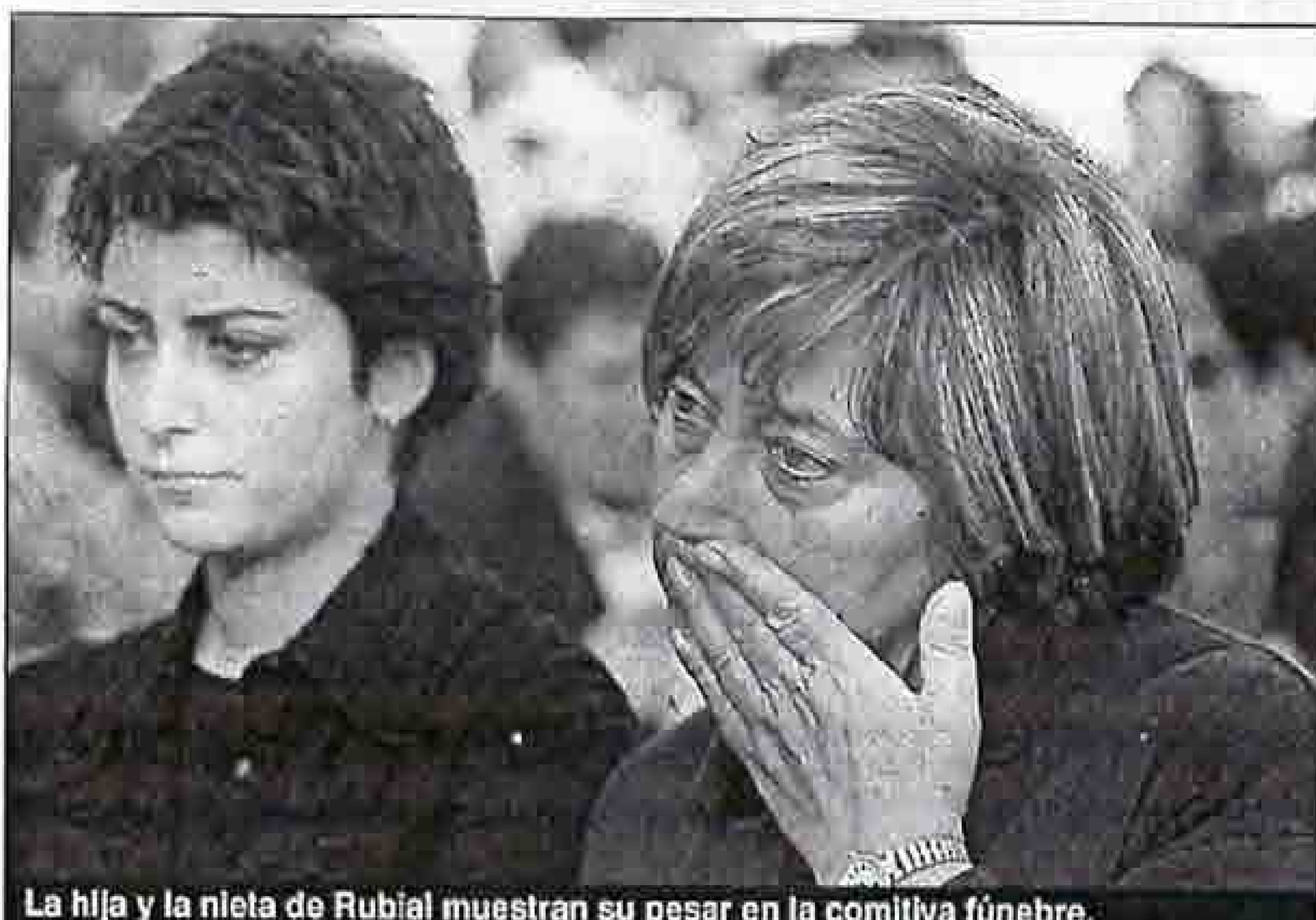
La hija y la nieta de Rubial muestran su pesar en la comitiva fúnebre.