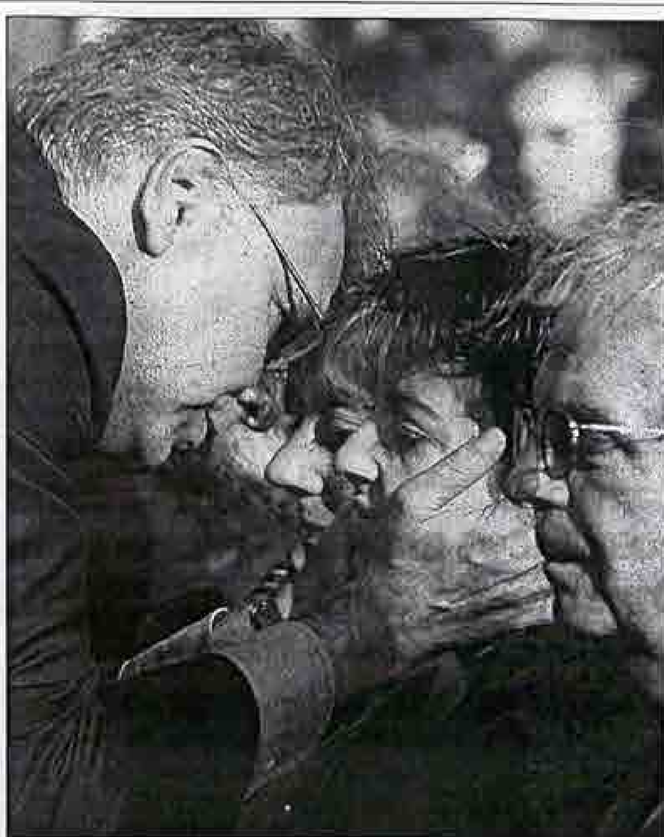
Felipe González besa a la nieta del histórico dirigente del PSOE.