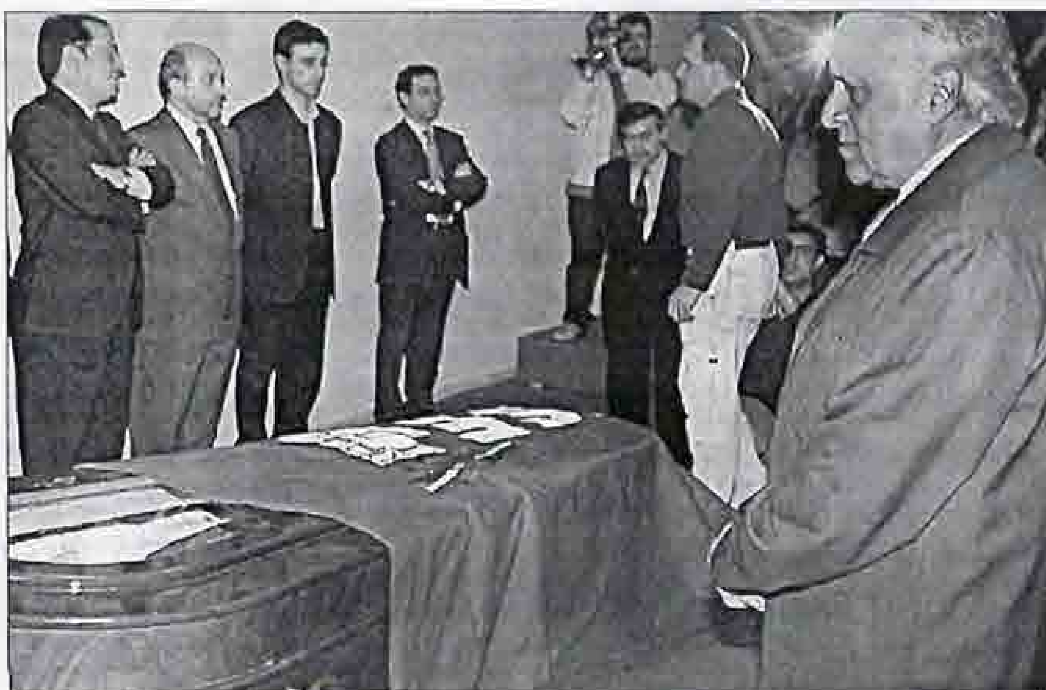
Xabier Arzalluz visitó la capilla ardiente instalada en la sede del PSOE en Bilbao