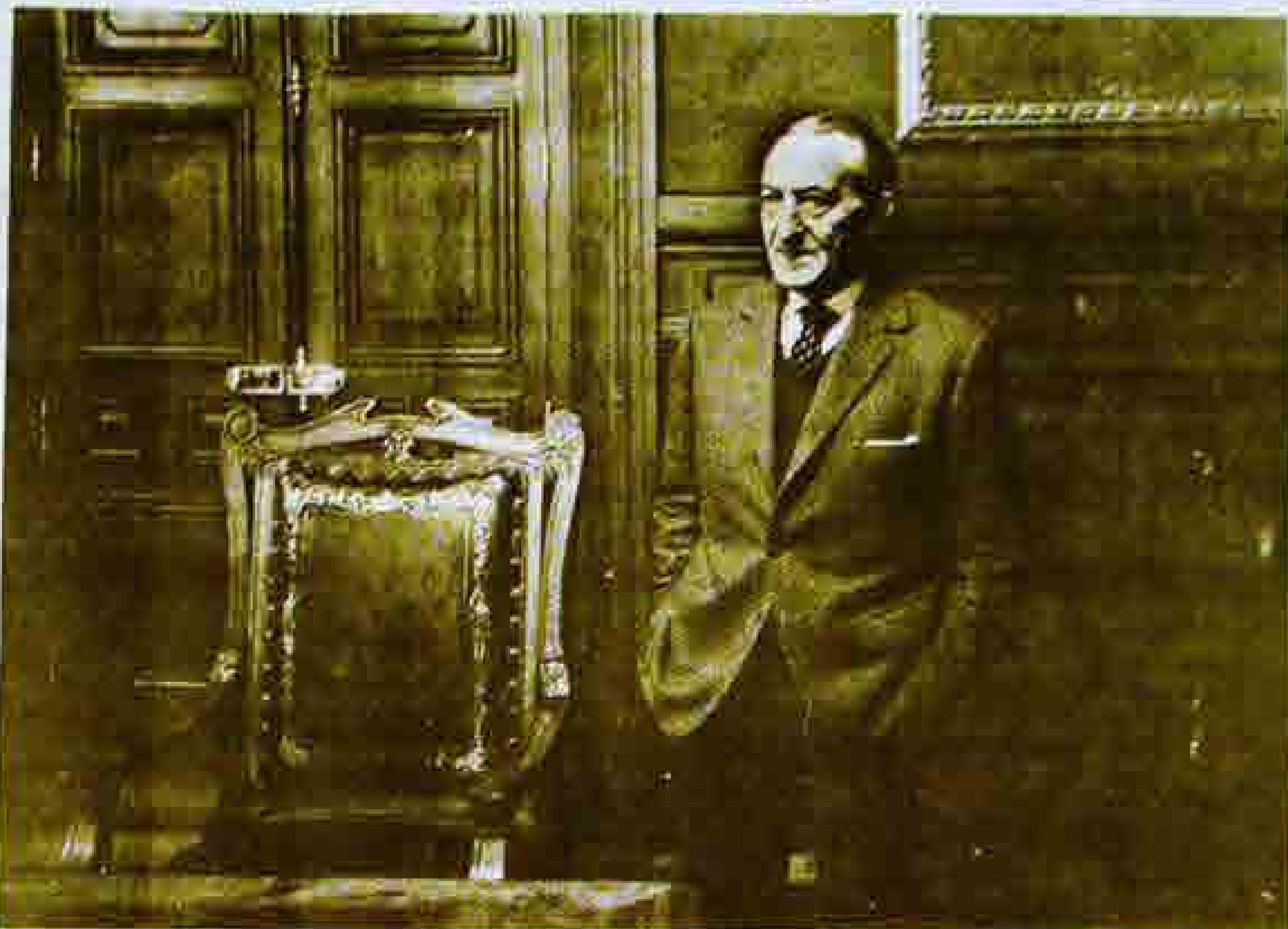
Ramón Rubial cumplió ayer sus primeras veinticuatro horas al frente del Consejo General Vasco

—D. ¿Esta Ramón Rubial preparado para abordar, como presidente del CGV, los problemas culturales, económicos, de orden público, etc., que existen hoy en Euzkadi?