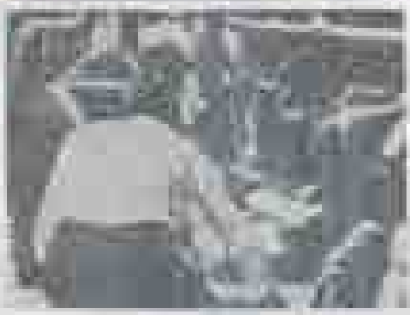
PEPE PEREZ DURANGO