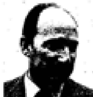
Euzkadi Euzkadi (PSO) Nació en Euzkadi en 1888. Fue el primer jefe del PNV. Ex presidente de Euzkadi. Miembro de las Cortes Españolas desde 1931. Miembro del PNV desde 1935 y representante de la UCD en el 1977. Ex ministro general de Euzkadi en el momento de su constitución en el momento de Euzkadi.