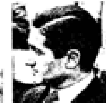
Euzkadi Euzkadi (PSO) Nació en Euzkadi en 1888. Fue el primer jefe del PNV. Ex presidente de Euzkadi. Miembro de las Cortes Españolas desde 1931. Miembro del PNV desde 1935 y representante de la UCD en el 1977. Ex ministro general de Euzkadi en el momento de su constitución en el momento de Euzkadi.