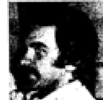
Euzkadi Euzkadi (PSO) Nació en Euzkadi en 1888. Fue el primer jefe del PNV. Ex presidente de Euzkadi. Miembro de las Cortes Españolas desde 1931. Miembro del PNV desde 1935 y representante de la UCD en el 1977. Ex ministro general de Euzkadi en el momento de su constitución en el momento de Euzkadi.