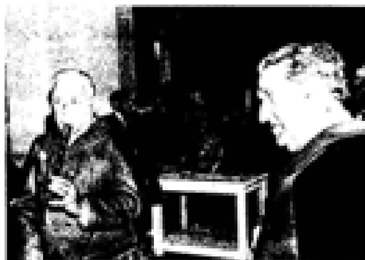
Los diputados socialistas les dieron razones que los congresos votaron produciendo.

media hora, dio idéntico resultado, lo mismo que las tres siguientes, realizadas al recordarse la maratónica sesión, después de que los quince congresos hubieran alcanzado juntos en el momento "El Foral". Ya entonces empezaban a correr rumores que el diputado socialista por Vi-