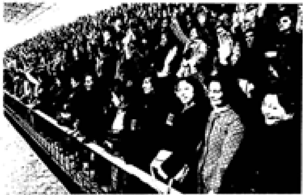
Los trabajadores de la fábrica de Vizcaya irrumpen al pleno desde el "al" al momento.

Año nuevo con Bizkaia prohibiendo por completo cualquier tipo de venta de alcohol. Los propietarios de los bares, que hasta ahora tenían permiso para vender alcohol, ya no podrán hacerlo. Una de las medidas más importantes de este año nuevo es la prohibición de la venta de alcohol en los bares. (Página 12)