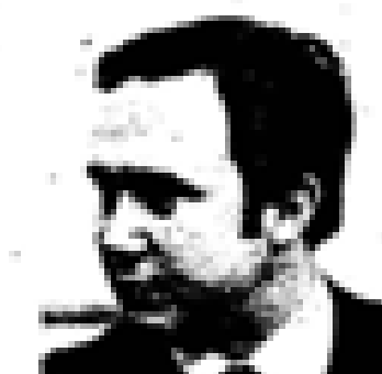
Euzkadi Euzkadi (PSO) Nació en Euzkadi en 1888. Fue el primer jefe del PNV. Ex presidente de Euzkadi. Miembro de las Cortes Españolas desde 1931. Miembro del PNV desde 1935 y representante de la UCD en el 1977. Ex ministro general de Euzkadi en el momento de su constitución en el momento de Euzkadi.