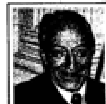
Euzkadi Euzkadi (PSO) Nació en Euzkadi en 1888. Fue el primer jefe del PNV. Ex presidente de Euzkadi. Miembro de las Cortes Españolas desde 1931. Miembro del PNV desde 1935 y representante de la UCD en el 1977. Ex ministro general de Euzkadi en el momento de su constitución en el momento de Euzkadi.