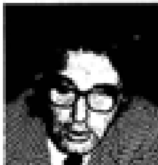
José Antonio Aguirre (PSO) Nació en Vitoria en 1882. Creador del PNV. Ex presidente de Euzkadi. Miembro de las Cortes Españolas desde 1931. Miembro del PNV desde 1935 y representante de la UCD en el 1977. Ex ministro general de Euzkadi en el momento de su constitución en el momento de Euzkadi.