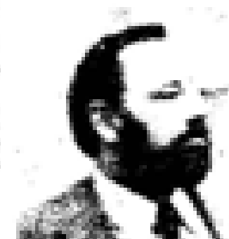
Euzkadi Euzkadi (PSO) Nació en Euzkadi en 1888. Fue el primer jefe del PNV. Ex presidente de Euzkadi. Miembro de las Cortes Españolas desde 1931. Miembro del PNV desde 1935 y representante de la UCD en el 1977. Ex ministro general de Euzkadi en el momento de su constitución en el momento de Euzkadi.