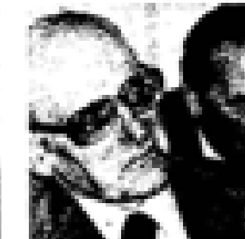
Euzkadi Euzkadi (PSO) Nació en Euzkadi en 1888. Fue el primer jefe del PNV. Ex presidente de Euzkadi. Miembro de las Cortes Españolas desde 1931. Miembro del PNV desde 1935 y representante de la UCD en el 1977. Ex ministro general de Euzkadi en el momento de su constitución en el momento de Euzkadi.