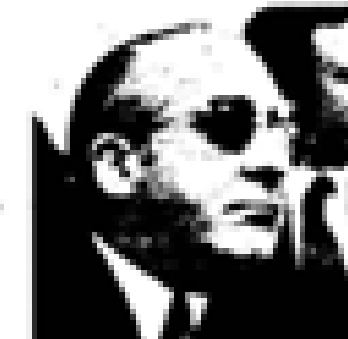
Euzkadi Euzkadi (PSO) Nació en Euzkadi en 1888. Fue el primer jefe del PNV. Ex presidente de Euzkadi. Miembro de las Cortes Españolas desde 1931. Miembro del PNV desde 1935 y representante de la UCD en el 1977. Ex ministro general de Euzkadi en el momento de su constitución en el momento de Euzkadi.