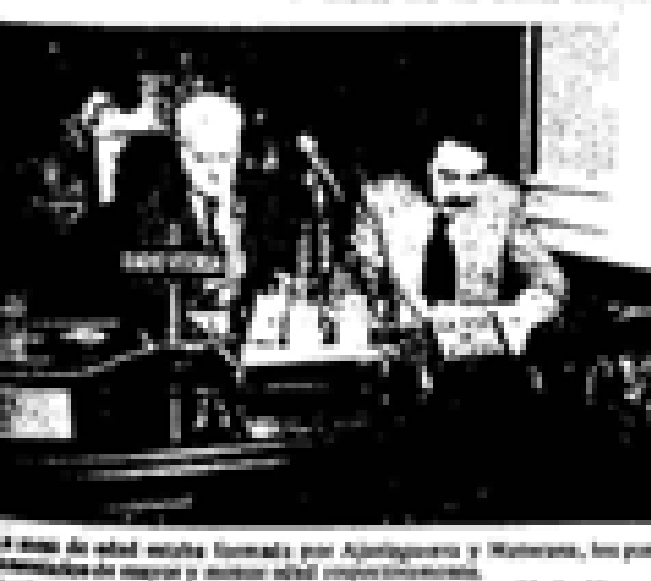
...de edad... por Ajaraguerra y Navarra, los por... y minoridad...

"Las votaciones reflejan que no se ha habido acuerdo previo entre el partido y la UCD", declaró posteriormente Bahial en la excitación de la Diputación, una vez finalizado el acto. "Esto no es un sistema parlamentario, con división una Dirección colegiada, y todos deberíamos asumir el honor. Aquí no hablé un Euzkadi".