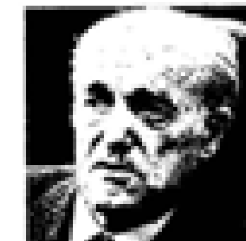
Euzkadi Euzkadi (PSO) Nació en Euzkadi en 1888. Fue el primer jefe del PNV. Ex presidente de Euzkadi. Miembro de las Cortes Españolas desde 1931. Miembro del PNV desde 1935 y representante de la UCD en el 1977. Ex ministro general de Euzkadi en el momento de su constitución en el momento de Euzkadi.