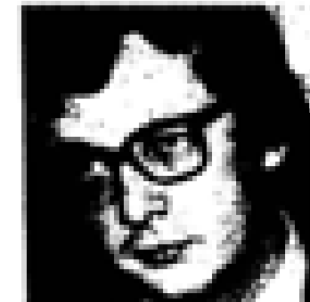
Tomás Euzkadi (PSO) Nació en Euzkadi en 1888. Fue el primer jefe del PNV. Ex presidente de Euzkadi. Miembro de las Cortes Españolas desde 1931. Miembro del PNV desde 1935 y representante de la UCD en el 1977. Ex ministro general de Euzkadi en el momento de su constitución en el momento de Euzkadi.