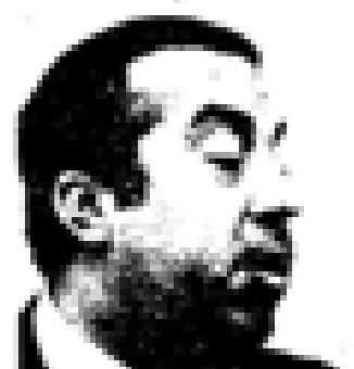
Euzkadi Euzkadi (PSO) Nació en Euzkadi en 1888. Fue el primer jefe del PNV. Ex presidente de Euzkadi. Miembro de las Cortes Españolas desde 1931. Miembro del PNV desde 1935 y representante de la UCD en el 1977. Ex ministro general de Euzkadi en el momento de su constitución en el momento de Euzkadi.