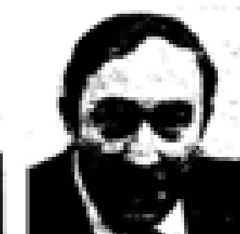
Euzkadi Euzkadi (PSO) Nació en Euzkadi en 1888. Fue el primer jefe del PNV. Ex presidente de Euzkadi. Miembro de las Cortes Españolas desde 1931. Miembro del PNV desde 1935 y representante de la UCD en el 1977. Ex ministro general de Euzkadi en el momento de su constitución en el momento de Euzkadi.