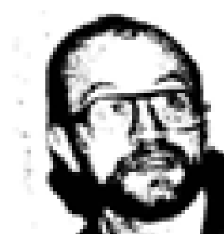
Euzkadi Euzkadi (PSO) Nació en Euzkadi en 1888. Fue el primer jefe del PNV. Ex presidente de Euzkadi. Miembro de las Cortes Españolas desde 1931. Miembro del PNV desde 1935 y representante de la UCD en el 1977. Ex ministro general de Euzkadi en el momento de su constitución en el momento de Euzkadi.