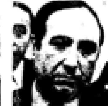
Euzkadi Euzkadi (PSO) Nació en Euzkadi en 1888. Fue el primer jefe del PNV. Ex presidente de Euzkadi. Miembro de las Cortes Españolas desde 1931. Miembro del PNV desde 1935 y representante de la UCD en el 1977. Ex ministro general de Euzkadi en el momento de su constitución en el momento de Euzkadi.